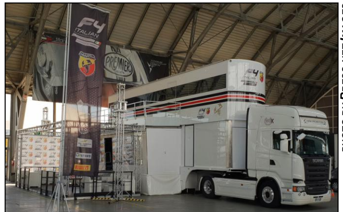
DAL KARTING ALLA F.4, I MEZZI DI WSK PROMOTION SONO UNA PRESENZA IMPORTANTE SUI CIRCUITI DEL MOTORSPORT.